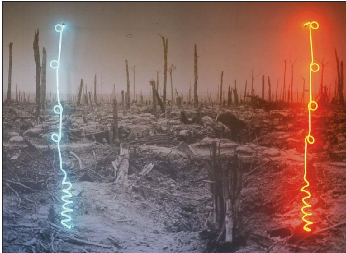
‘No man’s land’, een werk van Geert Koevoets uit 2002. (GF)

■ IEPER/PASSENDALE – Geert Koevoets is een kunstenaar uit het Nederlandse Tilburg. Gefascineerd door de Eerste Wereldoorlog ontwerpt hij momenteel een bijzonder ‘monument’ ter herdenking ervan. ‘Varkensstaarten in neon als baken van hoop’, dat zou het moeten worden. Of het een kans krijgt is nog niet zeker, want momenteel zit alles in de fase van onderzoek naar de kostprijs en de technische haalbaarheid.